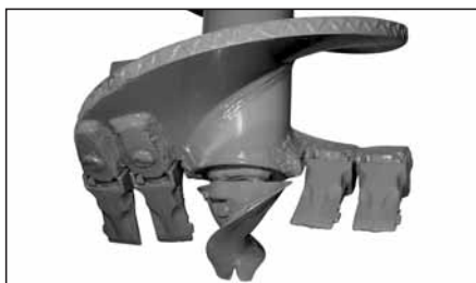
PUNTA ELICOIDALE con doppia elica, taglienti in acciaio antiusura imbullonati, per lavoro in medi terreni per mod. TR 600/1200/1500.

HELICOIDAL DRILL with double helix, steel edges anti-wear rivetted for medium grounds for mod. TR 100/180/300.