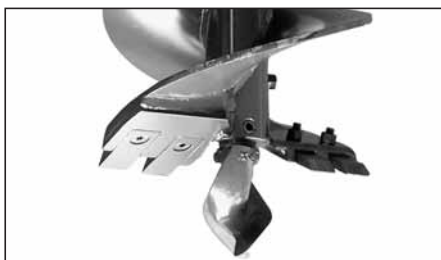
PUNTA ELICOIDALE con doppia elica, taglienti in acciaio antiusura imbullonati, per lavoro in medi terreni per mod. TR 100/180/300.

Model TR 600/1200/1500: the tools available have diameter of 200, 250, 300, 350, 400, 500, 600, 800 mm and lengths of 1000, 1500, 2000 mm.